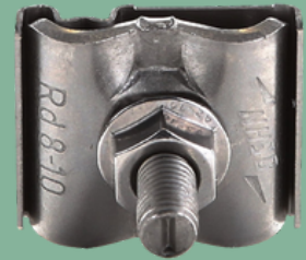
DEHN aardklem 8-10