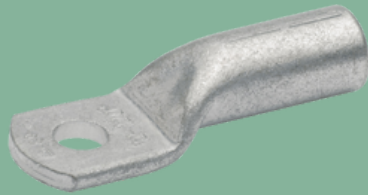
Kabelschoen diverse afmetingen